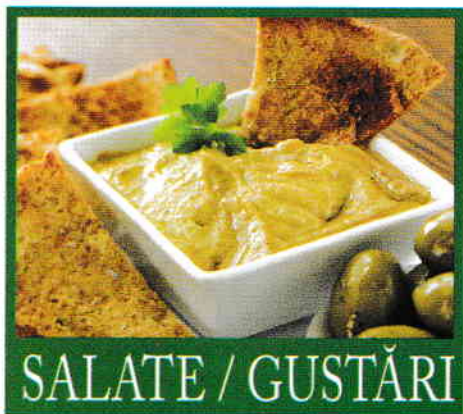
SALATE / GUSTĂRI